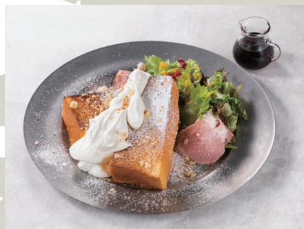
ふわとろフレンチトースト 580 (税込 638)