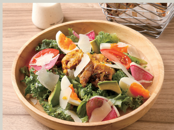
タンドリーチキンの パワーサラダ (パン付き) (税込 1,738)