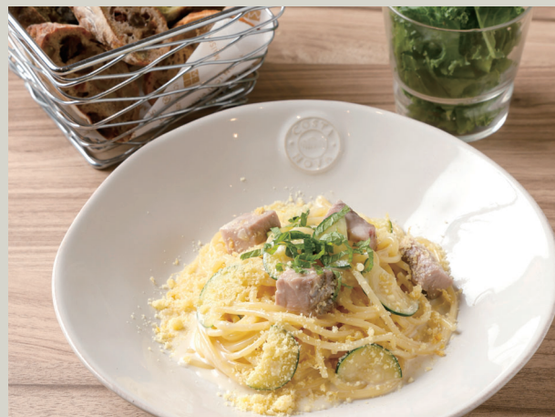
霧島黒豚のレモンチーズ パスタ (パン・サラダ付き) (税込 1,628)