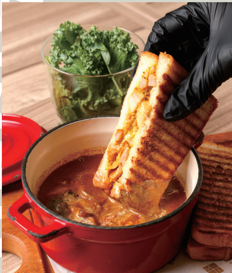
バターミルクカレーと タンドリーチキンのパン de シチュー (税込 1,738)