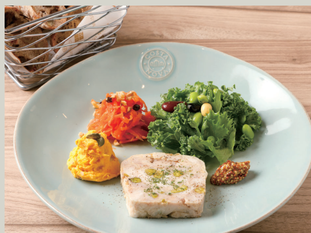
本日のデリプレート (パン付き) (税込 1,628)